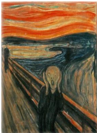
جیغ اثر ادوارد مونش ۱۸۹۳

«اکسپرسیونیسم» را چنین تعریف می‌کند: «هنر اکسپرسیونیسم هنری است که یک فشار یا ضرورت درونی را آزاد می‌کند. این فشار بر اثر عاطفه یا احساس ایجاد می‌شود و اثر هنری به صورت مفر یا دریچه‌ای درمی‌آید که به وسیله آن تأثیر روانی تحمل‌ناپذیر به تعادل مبدل می‌شود. آزاد شدن نیروی روانی به این صورت ممکن است به حرکات تند منجر شود و ظواهر امور طبیعی را چنان دگرگون کند که زشت به نظر آید.» (۱۳۷۱: ۱۸۳)