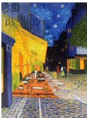
ترانس کافه در شب ۱۸۸۸

میخانه‌ای: «چو تب مهربان و صمیمی / میخانه‌های غم‌آلود با سقف کوتاه و ضربی / و روشنی‌های گم‌گشته در دود؛ و یاری که با او همراه است گویی خود وان گوگ است؛ زیرا او هم آنچه را اخوان دیده به تصویر کشیده است. «هر جا که من گفتم، آمد این گوشه آن گوشه شب / هر جا که من رفتم آمد / او دید من نیز دیدم. دور از اندیشه نیست که هنرمندان هم آرا، سایه یکدیگر در آفرینش آثارشان باشند.» (اخوان ثالث، ۱۳۶۰: ۹۸-۹۹)