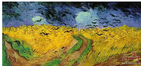
گندمزار با کلاغها، آخرین اثر وان گوگ ۱۸۸۹

تکرار زخم کهنه تاریخی اضطرابی به وسعت چندین قرن را در شعر اخوان ایجاد کرده است. نمونه هایی از این دست در تاریخ ایران به وفور دیده می شود که هیچ رنگ شادی جز خطوط تکرار شده و منحنی ندارد و آسمانی تیره و کشتزاری ملخ زده بهترین بازتاب آن است.