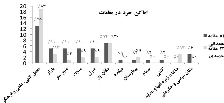
نمودار شماره (۳)

نمودار شماره (۳) علاوه بر نمایش کمی میزان به کارگیری مکان خرد، بیانگر علاقه دو نویسنده به یک مکان خاص نیز می‌باشد. ذکر این نکته ضروری است که محفل علمی، ادبی و فرهنگی در مقامات دارای تنوع مکانی است یعنی می‌تواند در بازار، مسجد، میکده، خانه و... تشکیل شود که در تعیین درصدها به هم‌پوشانی مجالس مذکور در انواع خرده مکان‌ها توجه شده است. مکان‌هایی که درصدها صفر لحاظ شده به معنی عدم وجود آن‌ها در یکی از دو اثر تطبیقی است.